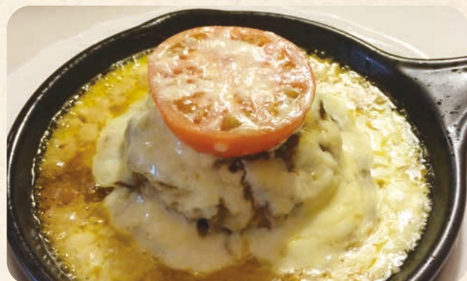
トマトチーズフォンデュビーフハンバーグ