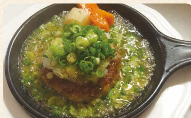
九条ネギの塩ダレビーフハンバーグ