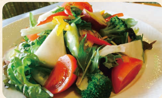
パセリのおまかせ野菜サラダ