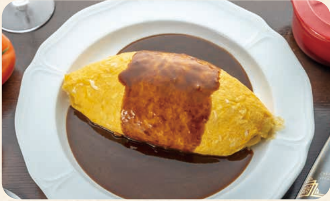
デミグラスソースオムライス