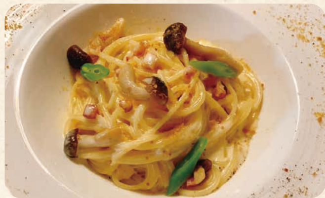
ベーコンとキノコの クリーム スパゲティ