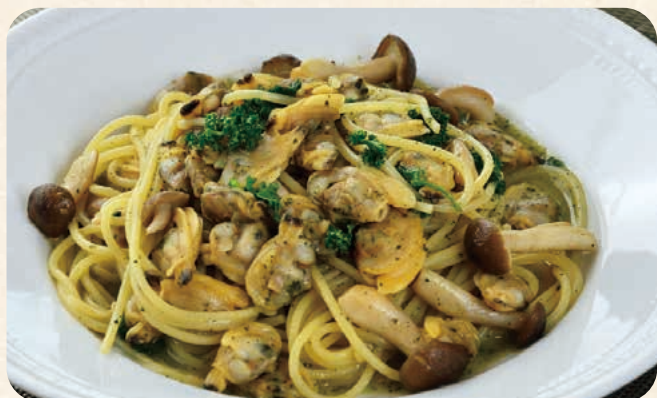
アサリとしめじの オイル スパゲティ