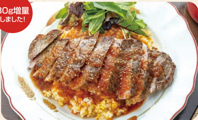
サーロインステーキ ピラフ オージービーフ 180g