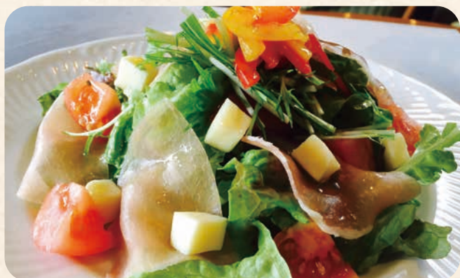
生ハムとモッツアレラチーズのサラダ