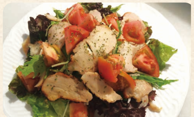
ローストチキンとトマトのサラダ