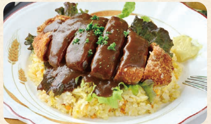
三元豚のデミカツ洋どん