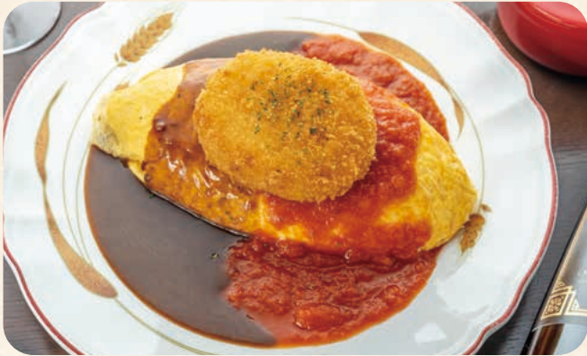
カニクリームコロッケの 2色ソース オムライス