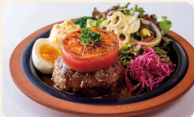
ビーフハンバーグ焼きトマトをのせて