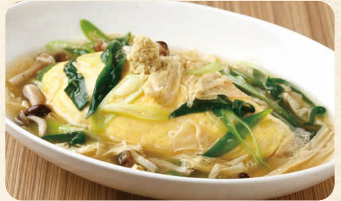
京湯葉と九条ネギ 葛のスープ オムライス