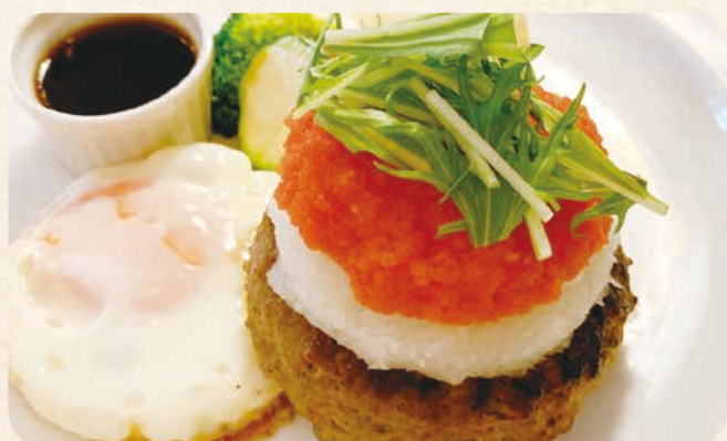
明太子とろろビーフハンバーグ