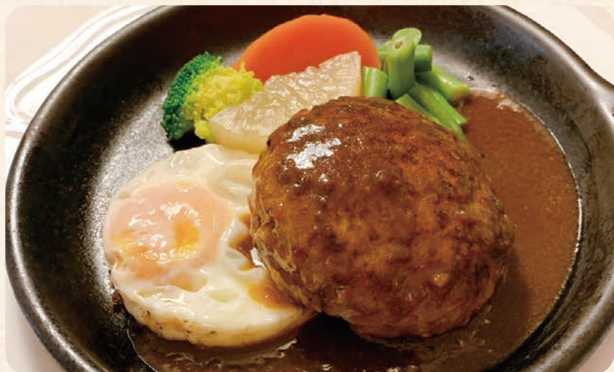
ハンバーグステーキ デミグラスソース