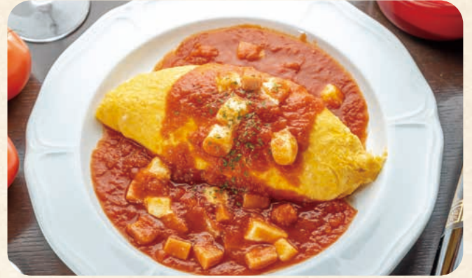
ベーコンとモッツアレチーズの トマトソースオムライス