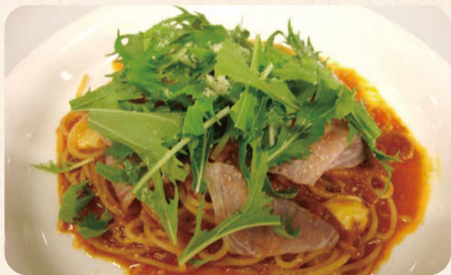
生ハムとモッツアレラチーズの トマトソース スパゲティ